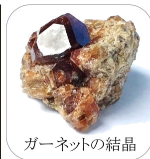
ガーネットの結晶